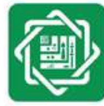
بيت التمويل الكويتي